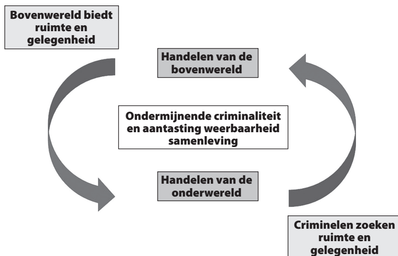
Figuur 2 De tweezijdige verwevenheid in beeld

Criminelen maken gebruik van de mogelijkheden die de overheid en andere gevestigde instituten hun bieden voor het uitvoeren van hun criminele activiteiten. Ze hebben informatie en vergunningen nodig van de lokale overheid; ze hebben een bankrekening nodig en moeten banktransacties uitvoeren om hun criminele geld wit te wassen; voor het investeren in onroerend goed hebben ze makelaars, projectontwikkelaars en notarissen nodig. Boeren worden door criminelen benaderd om hun leegstaande schuren te verhuren, waarbij het uiteindelijke oogmerk de productie van wiet of synthetische drugs is. Groepen, families, individuen, maar ook bedrijven en ondernemers die actief zijn in of vanuit het criminele circuit zoeken voortdurend naar mogelijkheden en ruimte – waarbij ze vaak beschikken over allerlei hulpbronnen, zoals kennis van de sociale en machtsverhoudingen in de wijk of buurt of van sociale en familiale netwerken, hun voorkomen (indrukwekkend fysiek, brutaliteit), liquide middelen, intermediairs en (soms) de intelligentie om de situatie naar hun hand te zetten. Aan de andere kant is het de overheid die vergunningen verleent en erop moet toezien dat men zich houdt aan de daarin gestelde voorwaarden. Daarbij kunnen signalen van criminaliteit worden opgevangen of niet, en als die worden opgevangen, kan er iets mee worden gedaan of niet. Er iets mee doen kan weer conflicteren met beleidsdoelstellingen of politieke prioriteiten, of met persoonlijke belangen.